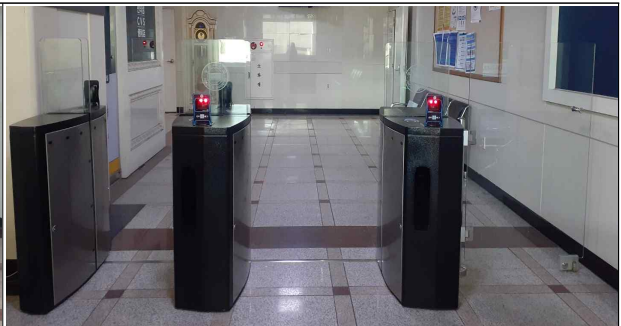
미르관 2동 출입구