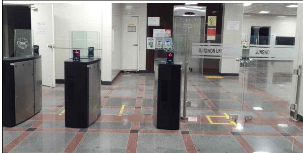
누리관 5동 출입구