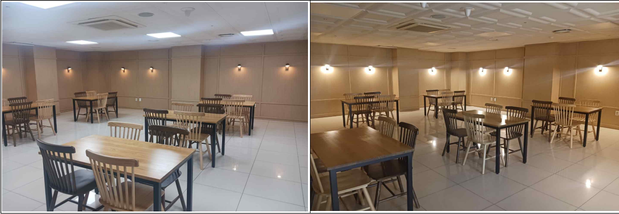
□ 여자생활관(누리관) 휴게공간 전경 및 위치(6동 2층 E-mart 옆)