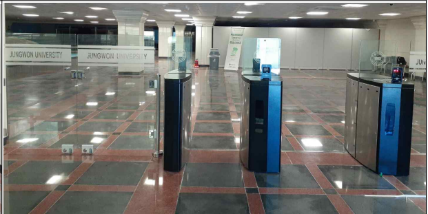
누리관 6동 출입구